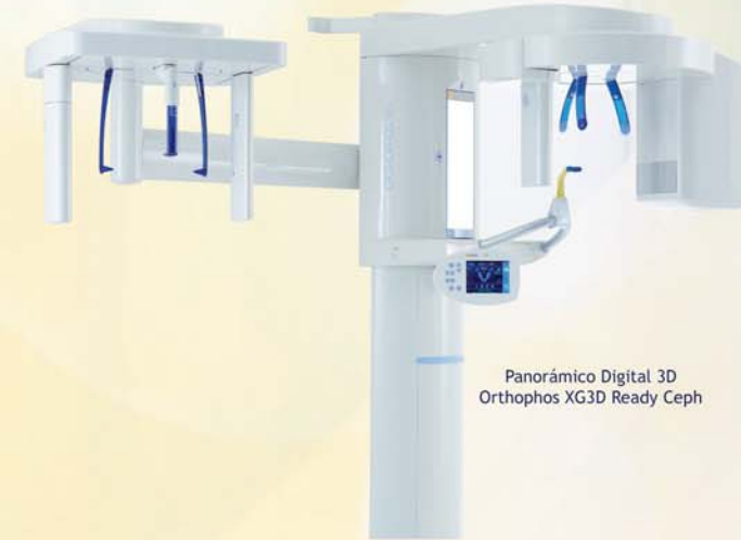
Panorámico Digital 3D Orthophos XG3D Ready Ceph