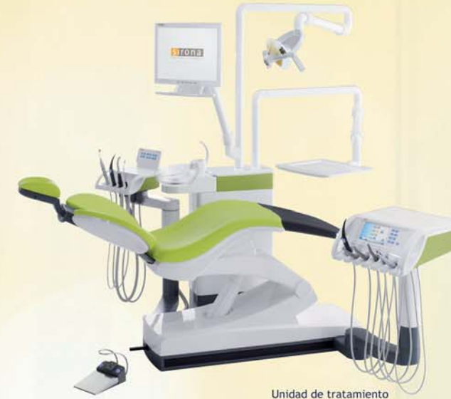
Unidad de tratamiento TENE0